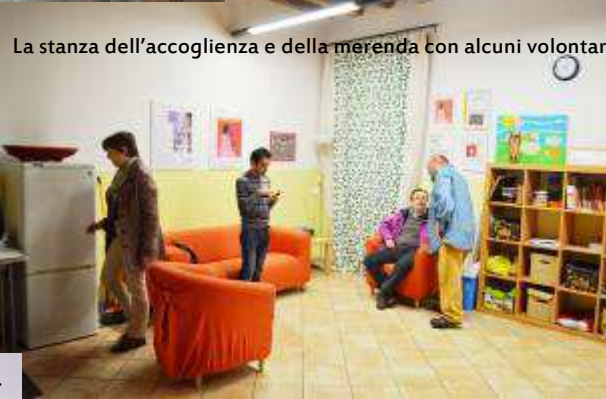
La stanza dell'accoglienza e della merenda con alcuni volontari