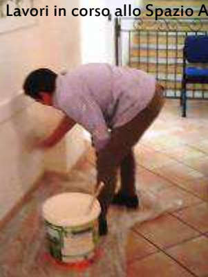
Lavori in corso allo Spazio Accoglienza...

Le nostre attività sono principalmente dedicate all'accoglienza e all'integrazione di famiglie, residenti nel Comune di Villafranca, sia italiane che provenienti da circa 20 paesi del mondo, e ci fa piacere continuare a riceverle, ma con più agio, nelle prime stanze che le persone incontrano, come è stato fino ad ora!