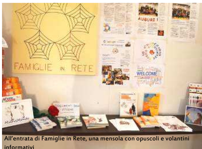
All'entrata di Famiglie in Rete, una mensola con opuscoli e volantini informativi

Famiglie in Rete ha guadagnato uno spazio maggiore