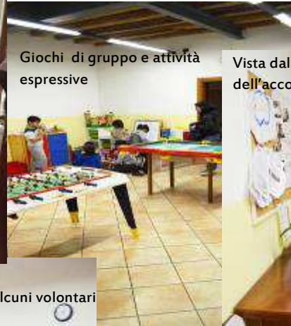
Giochi di gruppo e attività espressive