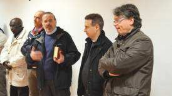
Il Parroco con Sindaco e Vicesindaco in un momento dell'inaugurazione

I lavori di ristrutturazione hanno comportato un impegno economico notevole per la Parrocchia del Duomo , nonostante si sia potuto contare sulla disponibilità dei tecnici che hanno messo a disposizione gratuitamente alcune loro prestazioni. Sia il Parroco che il Sindaco e Vicesindaco di Villafranca hanno sottolineato l'importanza che le Associazioni di volontariato che si occupano delle famiglie –sia italiane che straniere– rivestono per questo territorio.