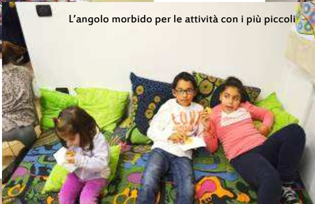
I locali adibiti ad attività musicali, lettura, drammatizzazione e agli incontri del Laboratorio linguistico-interculturale