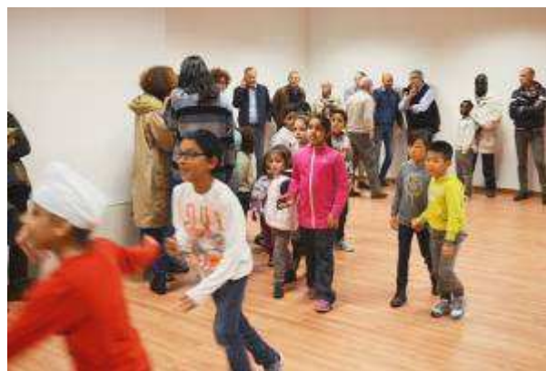
Il presidente di Famiglie in Rete mentre parla della nostra Associazione

GRAZIE DI CUORE ALLA PARROCCHIA DEL DUOMO CHE RENDE POSSIBILE TUTTO QUESTO!