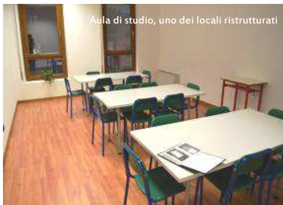
Aula di studio, uno dei locali ristrutturati