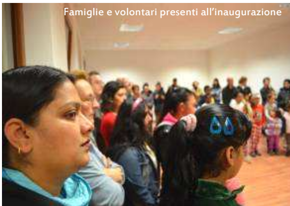
Famiglie e volontari presenti all'inaugurazione

14 NOVEMBRE: conclusi i lavori di ristrutturazione, il Parroco del Duomo di Villafranca, con il Sindaco, il Vice-sindaco e Assessore alle Politiche Sociali e i tecnici che hanno curato il progetto, ha inaugurato i nuovi locali alla presenza di volontari e famiglie che accedono alle attività delle associazioni.