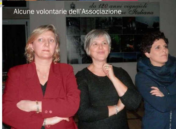
Alcune volontarie dell'Associazione