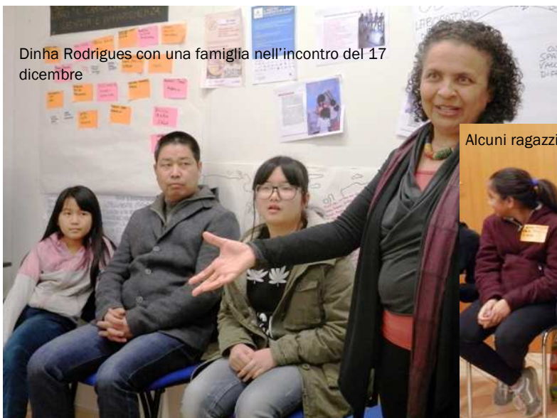
Alcuni ragazzi con una mediatrice culturale del Senegal