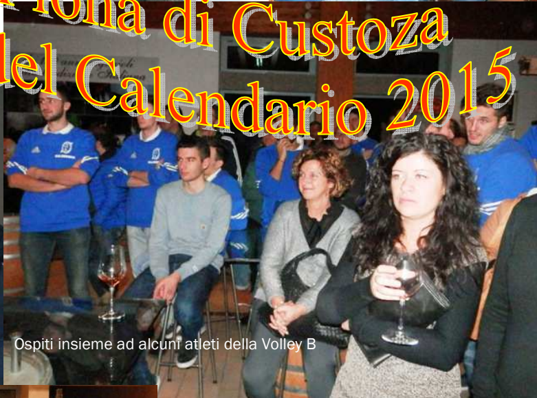
Ospiti insieme ad alcuni atleti della Volley B