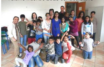
l'ultimo incontro 2013 del laboratorio

dipingendo, cantando, danzando, scrivendo poesie, guardando tutti insieme un film, parlando, ascoltando, confrontando diversi modelli culturali , con l'aiuto di alcuni genitori e la preziosa collaborazione delle mediatrici culturali di Terra dei Popoli , abbiamo imparato tantissime cose e soprattutto siamo stati tutti insieme comprendendo e apprezzando le nostre diversità!