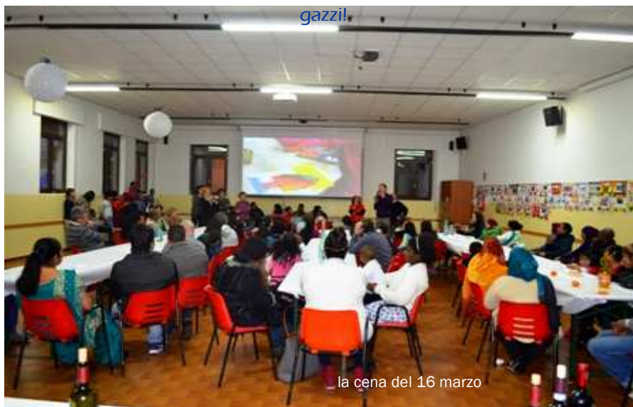
la cena del 16 marzo

Erano con noi il Parroco del Duomo, il Presidente e il Direttivo dell'Associazione, le mediatrici culturali, i genitori, i volontari, una nostra educatrice, rappresentanti di altre associazioni e, naturalmente...i ragazzi!