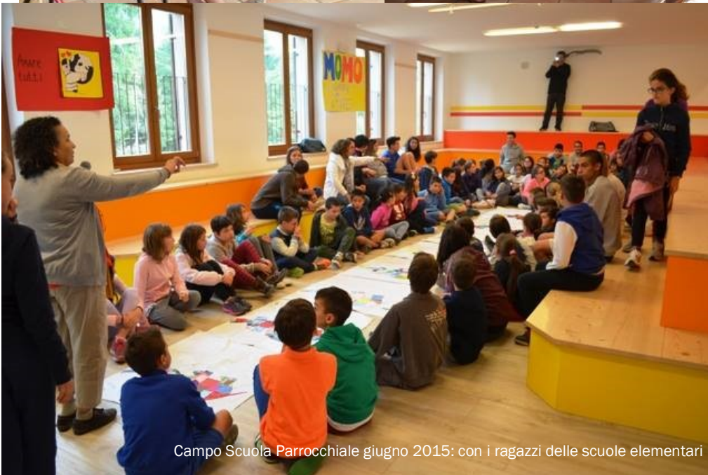
Campo Scuola Parrocchiale giugno 2015: con i ragazzi delle scuole elementari

CAMPO ESTIVO 4° e 5° ELEMENTARE 2015 CAMPOFONTANA (22-28 giugno 2015) Villafranca Diomo e MAP MANUALE DEL CAMPO