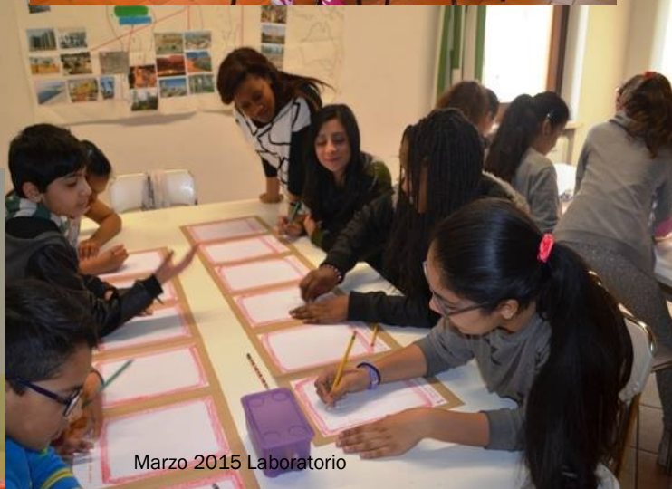
Marzo 2015 Laboratorio