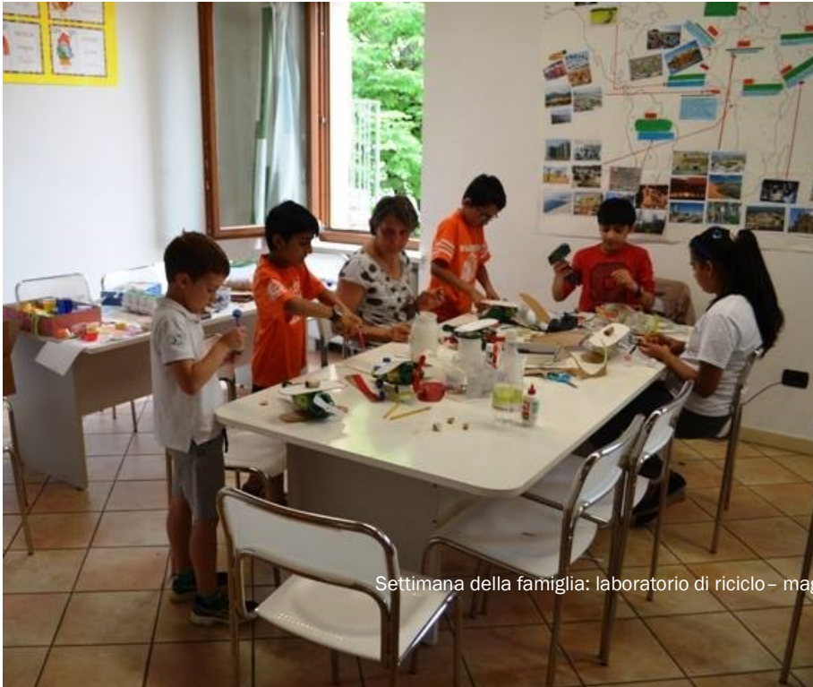
Settimana della famiglia: laboratorio di riciclo- maggio 2015