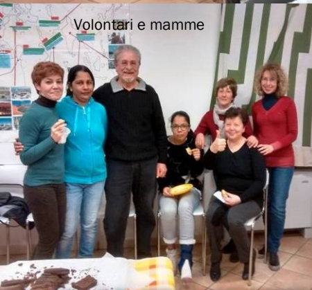
Volontari e mamme