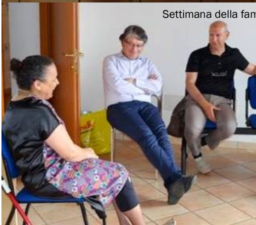
Settimana della famiglia: carte dei viandanti