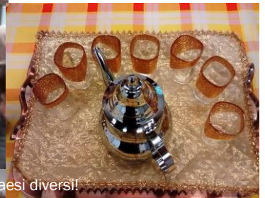
Gustare insieme cibi paesi diversi!