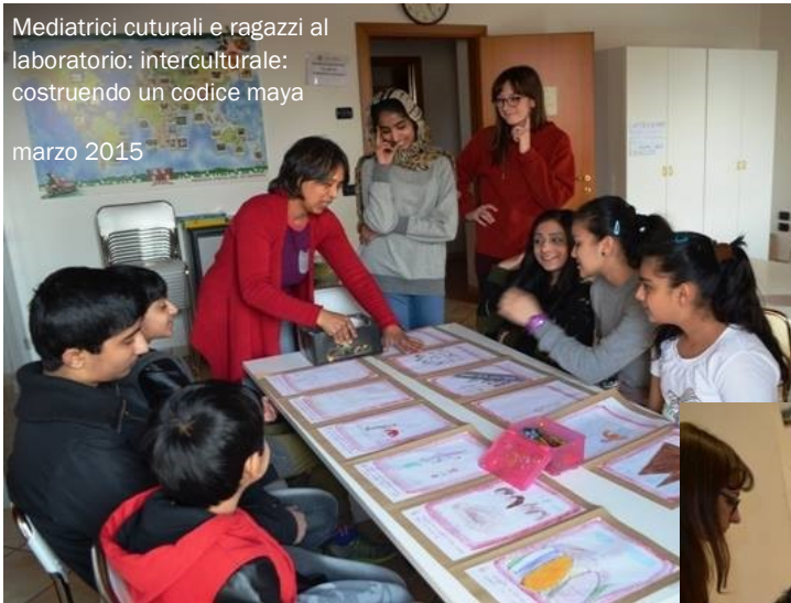
Mediatrici culturali e ragazzi al laboratorio: interculturale: costruendo un codice maya marzo 2015