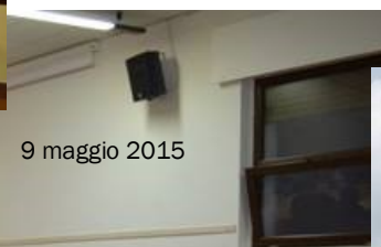
9 maggio 2015