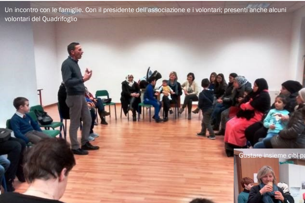
Un incontro con le famiglie. Con il presidente dell'associazione e i volontari; presenti anche alcuni volontari del Quadrifoglio

Iniziative e attività con le famiglie e i bambini presso lo Spazio Accoglienza: alcune immagini