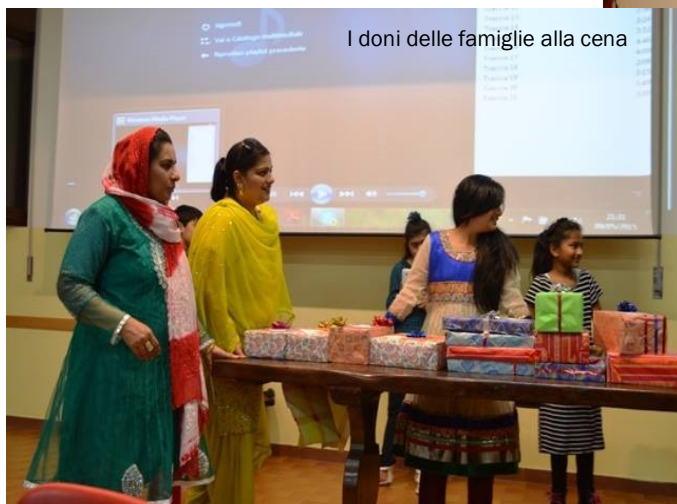
I doni delle famiglie alla cena