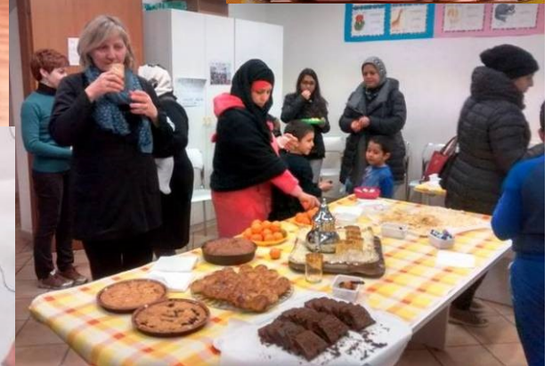
Scambio di doni